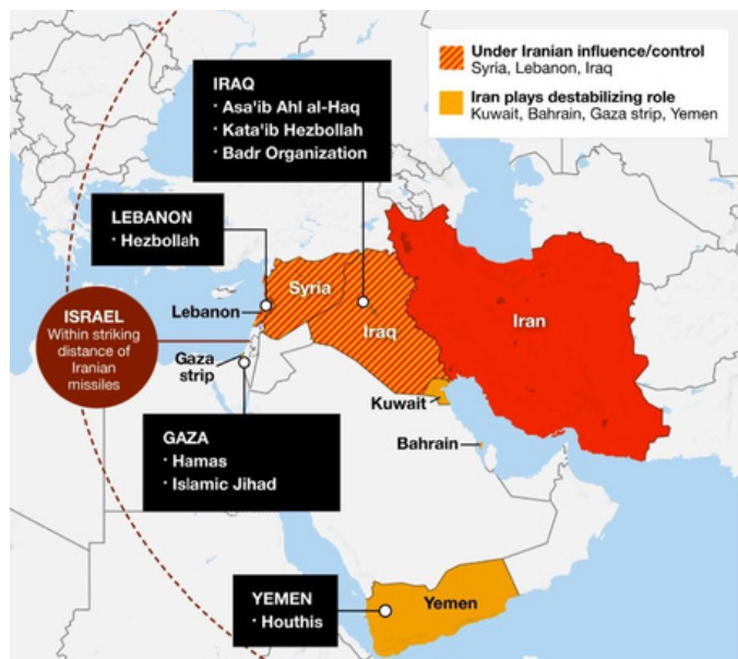
Carte de « l'Axe de la Résistance »