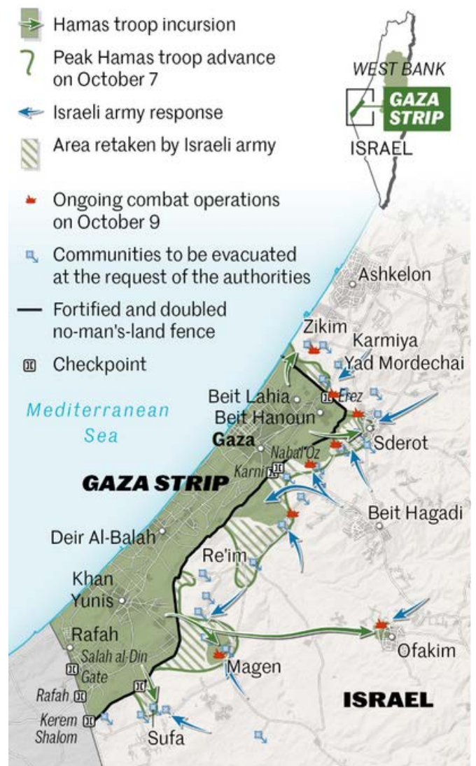
Situation au 9 octobre 2023, deux jours après les attaques du Hamas

Selon une enquête publiée par le magazine Le Point[49], les bilans quotidiens des victimes publiés par le « Ministère de la Santé » de la bande de Gaza, sous le contrôle du Hamas, sont surestimés, sans distinction entre civils et combattants, et incluent même les décès de causes naturelles. De plus, ils ont aussi souvent révélé des données contradictoires, voire improbables. Par exemple, le 26 octobre, le Hamas a rapporté 481 morts dans la journée, tout en affirmant que 626 femmes et enfants ont été tués ce jour-là.